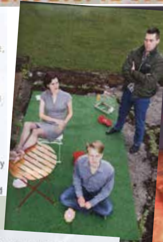
Stadtmagazin 37. 09/2011